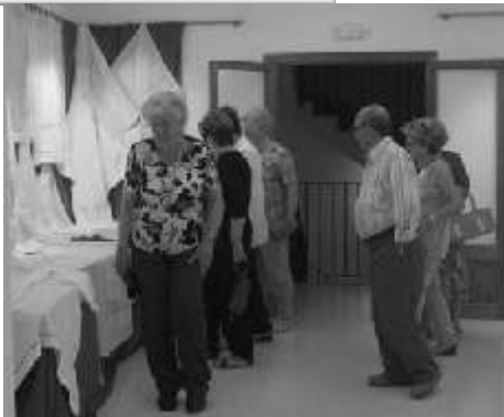
Exposició de brodats