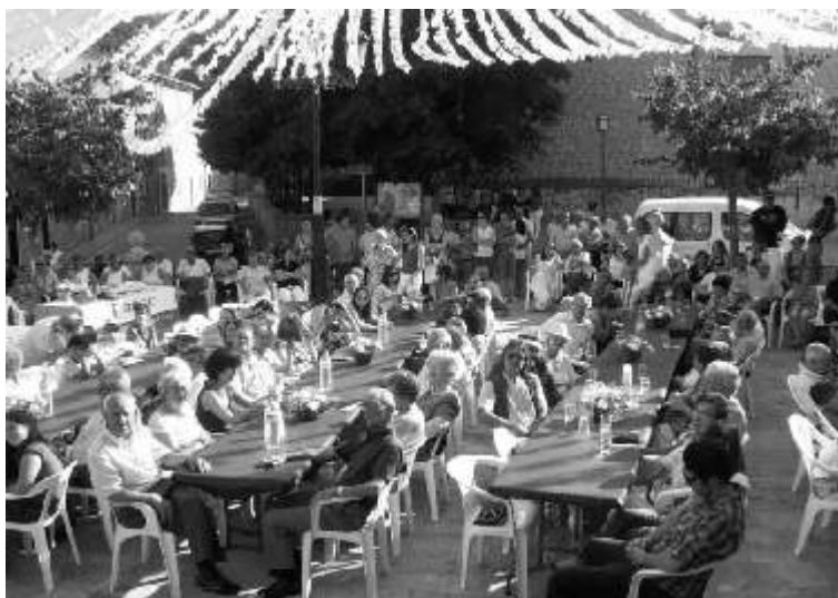
XXXVII Homenatge a la Gent Gran

L'horabaixa tingué lloc el XXXVII Homenatge a la Gent Gran del nostre poble. Després d'escoltar els parlaments de les autoritats presents, els nostres majors gaudiren d'un gelat escoltant l'actuació del Duo Pedro Granados .