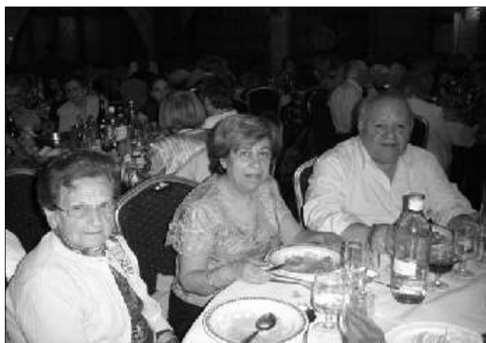
Dinar al Foro de Mallorca

dida pel P. Guiem Ramis Feliu TOR. A l'homilia, després d'unes breus paraules seves, va fer intervenir un al-lot i una al-lota, i també una padrina i un padrí. (podeu veure a la secció de Església Local el contingut del que es va llegir). A l'ofrena es varen presentar un seguit d'objectes, eines i demés, que recordaren el treball que antany realitzaven