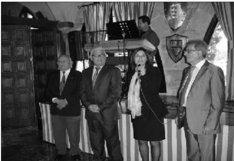
Parlaments després del dinar