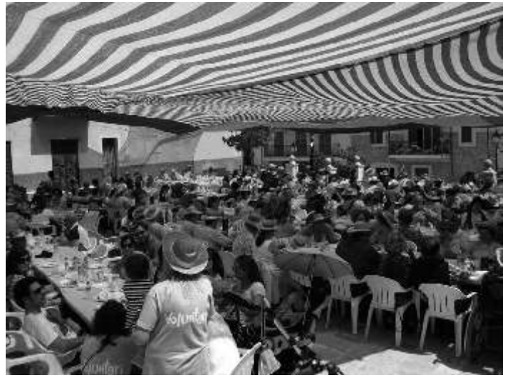
EL CLUB HARLEY ENS ACOMPANYA PER SEGON ANY CONSECUTIU