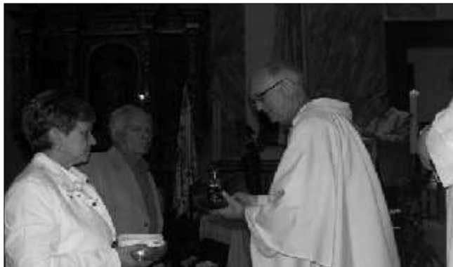
Presentació del pa i el vi

També presentam a l'altar el pa i el vi. El pa tret del blat crescut als nostres sementers i el vi tret del raïm madurat a les nostres vinyes. Déu, que, del treball esforçat i generós dels nostres majors n'ha tret un poble pròsper i feliç, d'aquest pa i aquest vi en farà el miracle de convertir-los en el seu Cos i la seva Sang. Perquè de la nostra feina i de la nostra vida en faci un miracle convertint-nos a nosaltres en convidats de la taula del seu Regne.