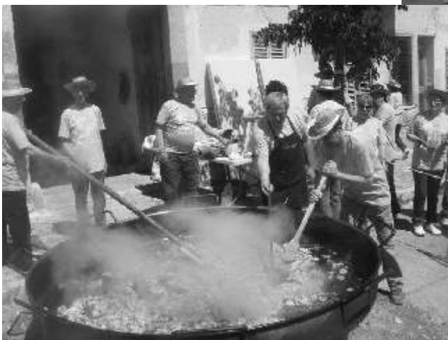
CUINERS I AJUDANTS PREPARANT PAELLA PER A 1.000 PERSONES