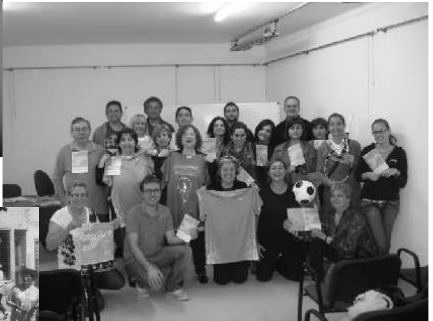
PRESENTACIO DE LA III DIADA SOLIDARIA