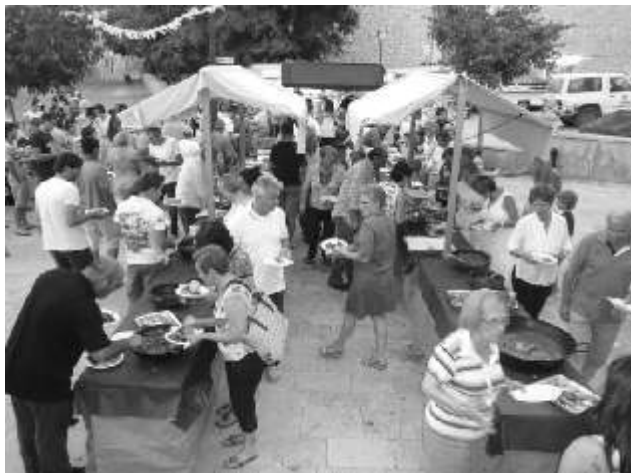
Bufet a la plaça de l'Ajuntament

El dissabte de Sant Joan, dia 23, es va fer l'ofrena floral al nostre patró. I a continuació a prop de 650 mancorins i amics de mancorins gaudiren del sopar de germanor a la plaça. Cal dir que va ser tot un èxit, tot gràcies a l'ajuda de voluntaris que de ben prest i amb un bon sol, ajudaren a posar taules, a recollir els diferents plats i en altres tasques.