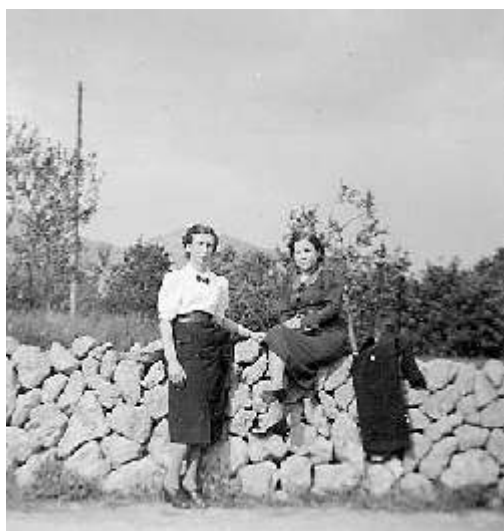
↳ Núm. 1 1938