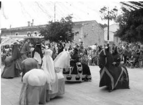
Cavallets de l'associació Arrels de la Vall