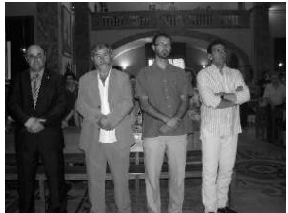
Autoritats a l'ofici