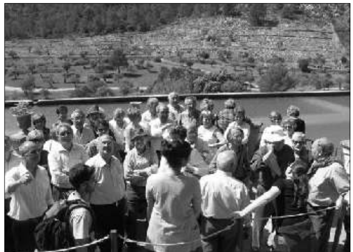
Instantània de la visita

relax. Després anaren a visitar la possessió de Raixa, d'origen àrab, amb uns dels jardins més importants de l'Illa, quan l'any 1229 el rei Jaume I va conquerir l'Illa, que estava en mans dels àrabs. Aquesta possessió va ser donada al Comte d'Empúries i posteriorment va ser de la família Despuig, comtes de Montenegro. El personatge de la família Despuig més important per la història de Raixa fou el Cardenal D. Antoni Despuig, home erudit que formà