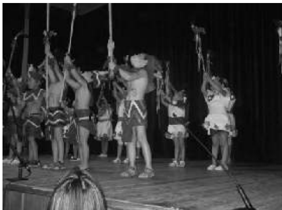
Els maies fan un ritual de pluja

Queda molt poc per acabar el curs i decidim celebrar-ho amb un gran festival. Hi ha hagut un poc de tot: danses, teatre, contes... Aquí en teniu una petita mostra: