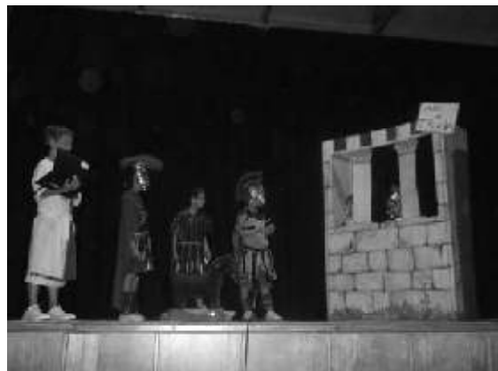
"Això és Troia" Grecs i romans fan teatre