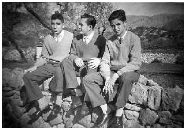
Núm. 2 1958 ↳

No és la primera vegada que hem comentat a la Revista Montaura com era la vida de treball dels mancorins i mancorines durant els dies feiners: fer feina al camp de sol a sol, fer carbó, anar a fer eixides, exsecallar, anar a Inca a fer sabates, i un llarg etc.