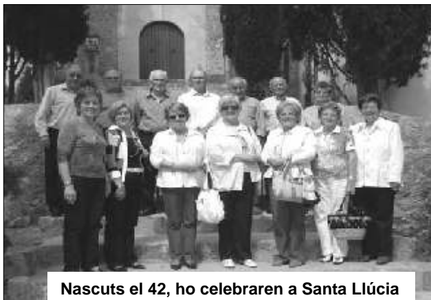
Nascuts el 42, ho celebraren a Santa Llúcia

A quin banc i on començares a fer feina? Vaig començar en es banc de Bilbao a Palma el dia 1 de juny de 1965. I en aquest banc i vaig fer vint-i-cinc anys de feina. Vaig passar per totes ses categories.