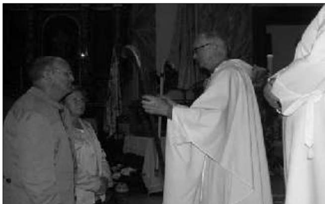
Presentació de les ofrenes

Presentam a l'altar uns brots d'olivera, símbol de la pau i la germanor entre tots els homes. Que el Senyor ens faci a tots nosaltres, petits i grans, sembradors de la seva Pau. Volem que els nostre poble sigui pacífic, pacificador i solidari. Que on hi hagi odi hi sembrem amor i on hi hagi discòrdia hi posem harmonia.