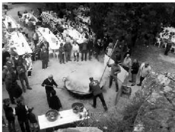
Paella Santa Llúcia