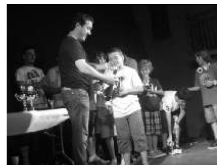
Moment de lliurar els trofeus