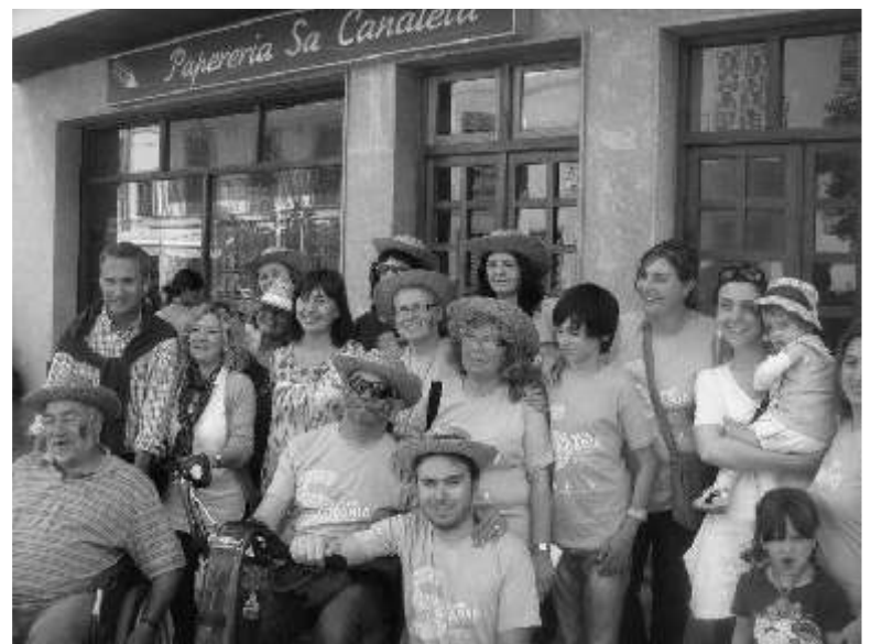
JA ESTAM PREPARATS PER SERVIR A TOTS ELS COMENSALS QUE ESTAN ASSEGUTS, ES VENGUEREN UNES 950 ENTRADES...