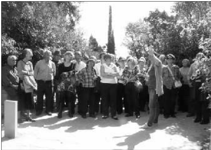
El guia-monitor donant explicacions

De bon matí un centenar de socis sortiren cap a Valldemossa, allà varen berenar de panada, vi, aigua, feren una passejada pels carrers d'aquella localitat que sempre són un