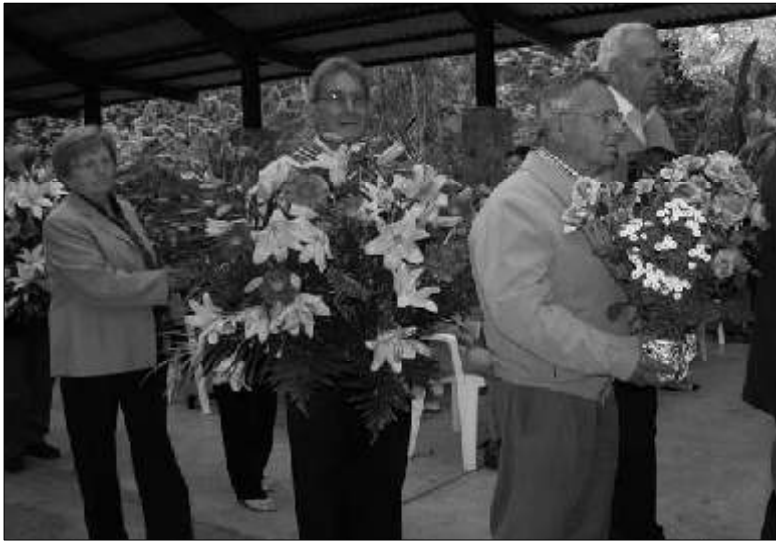
El president de l'Associació en el moment de fer l'ofrena

que fou cantada per l'Escolania dels Blavets. Durant la missa es va fer l'ofrena floral per part dels presidents de totes les associacions. Una vegada acabada la missa, tengueren temps per comprar algun record.