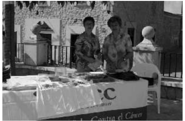
Taula informativa sobre el càncer

En honor al nostre patró es celebrà el solemne ofici concelebrat. Hi assistiren les autoritats locals i de pobles veïns. En acabar l'ofici s'oferí un aperitiu a tots els assistents.