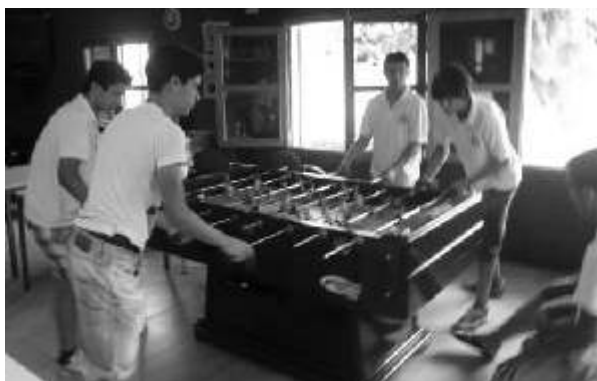
IV Torneig de futbolí

De dissabte dia 18 cal destacar: IV Torneig de Futbolí, V Torneig de Ping-Pong i la verbena animada per l'orquestra Oasis i Espais Verds.