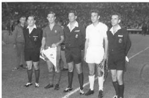
L'equip arbitral abans de començar el partit