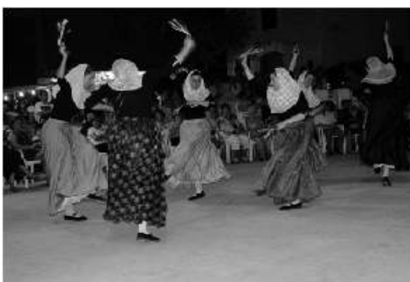
Festes Sant Joan