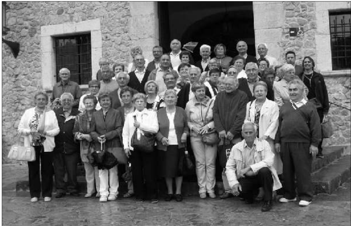
Els socis assistents a l'ofrena a la façana principal del Santuari

Tots gaudiren d'un dia ple de relax i allunyats de les preocupacions del dia a dia.