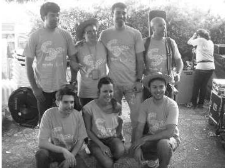
GRUP LOCAL DE "4 L"