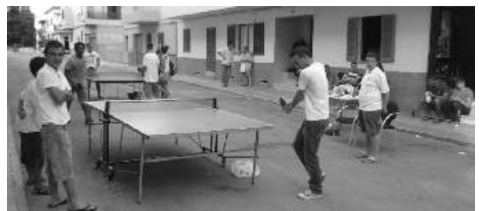
V Torneig de Ping-Pong