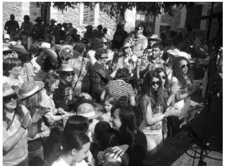
PREPARANT PER EL SORTEIG

ACABAM LA FESTA AMB "NO FEIM MUSICA, FEIM FESTA"