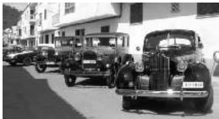
Cotxes clàssics al C/ Massanella