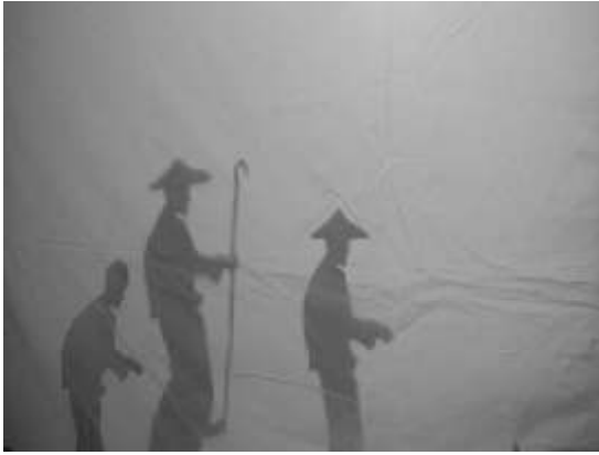
Teatre d'ombres xineses