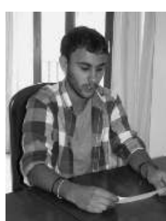
Pep Frontera / PP