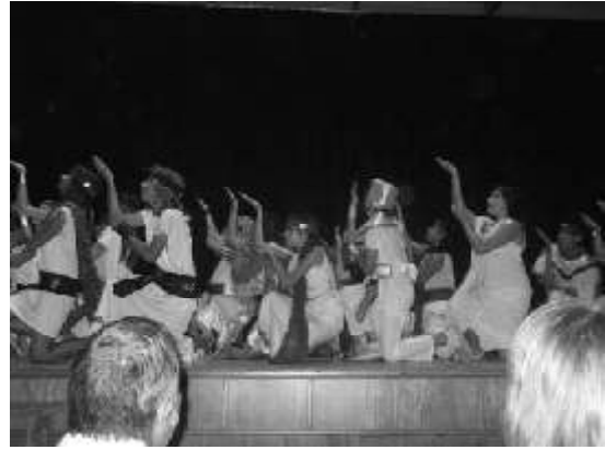
Els egipcis saben ballar!