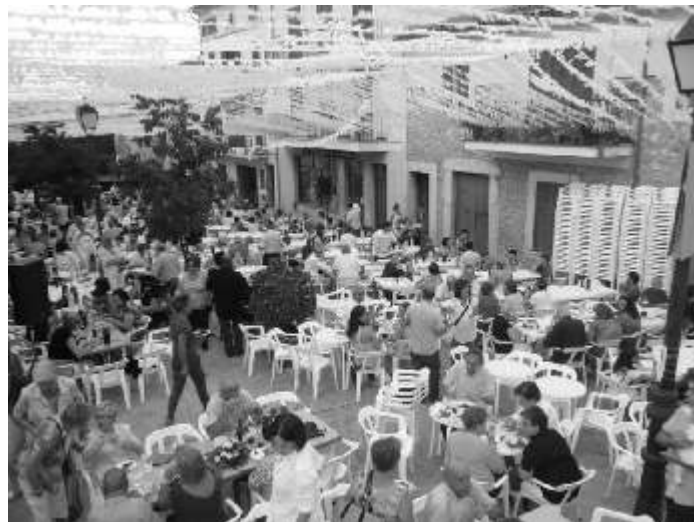
Sopant a la plaça d'Alt

Després del sopar i abans de l'actuació de l'humorista Ramon , es varen lliurar els trofeus dels diferents tornejos celebrats durant aquestes festes: