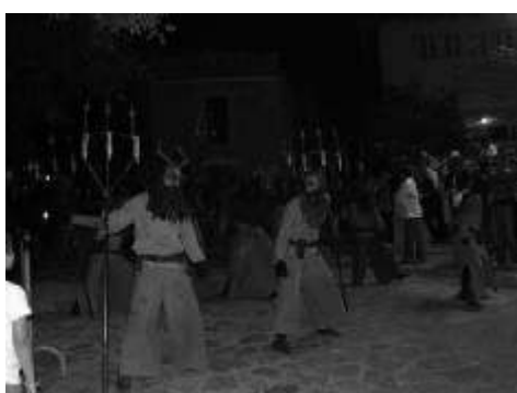
Nit de Foc del Solstici d'Estiu

La cloenda de les festes fou a càrrec dels dimonis de Mancor: