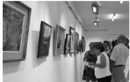
Exposició de pintura