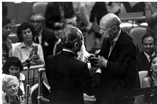
Parlant amb el Secretari General de la ONU

Però l'exili cada vegada es feia més llarg i feixuc. La dictadura es consolidava i Espanya aconseguia ingressar en els principals organismes internacionals. Aleshores, en el marc de la guerra freda, el català va decidir ampliar l'abast del seu combat contra les dictadures i el franquisme i convertir-lo en un missatge de pau mundial. El 1958 va flexibilitzar els termes del seu silenci, no del seu missatge, i va acceptar un concert a la seu de les Nacions Unides a Nova York, terreny neutral. Aquell mateix any, un grup de catalans iniciava una campanya per proposar-lo premi Nobel de la Pau. I tres anys més tard actuava davant de J. F. Kennedy amb la condició de poder entrevistar-se amb el president i plantejar-li la situació del poble català, la qual cosa va representar el trencament definitiu de l'autoimposat silenci.