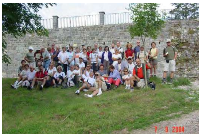
A Roncesvalles a punt de començar el camí

Sí, no sé quants anys fa, sé que hi vàrem anar dues vegades amb tota sa família. Tu vengueres en ses dues vegades que jo hi vaig anar.