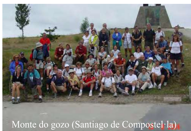
Monte do gozo (Santiago de Compostel·la)

Com es desenvolupa la teva vida de cada dia?