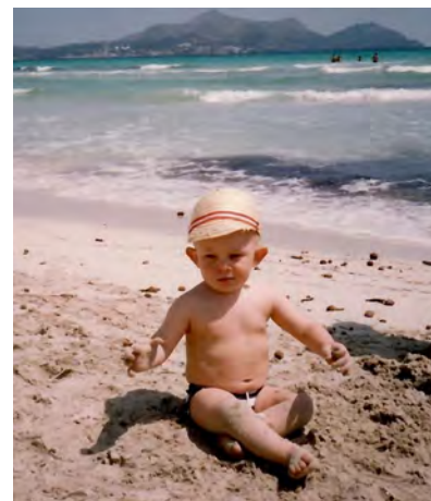
Gaudint de la platja i l'arena d'ell.

A través d'un amic meu, que era es capellà de Biniamar, molt amic del teu padrí, em consta que el teu padrí era un bon metge i a Lloseta estaven molt contents d'ell.