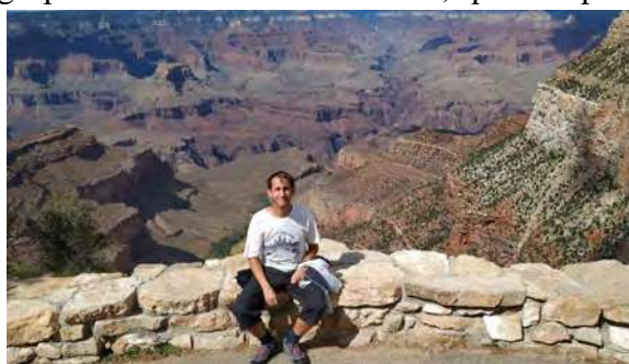
Parc Nacional del Gran Cañon, Arizona EUA