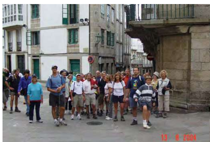
Arribada a Santiago

Parlem del moment actual, com anem d'amor o d'amors?